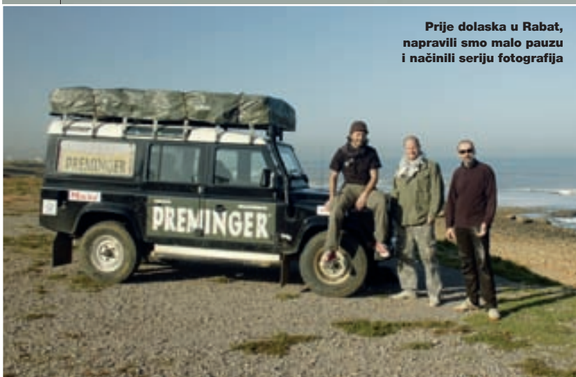
Prije dolaska u Rabat, napravili smo malo pauzu i načinili seriju fotografija

Ali, naš put za sada ne vodi tamo. Naš plan je da slijedimo atlansku obalu Afrike, kroz