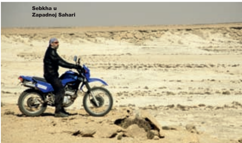
Sebkha u Zapadnoj Sahari