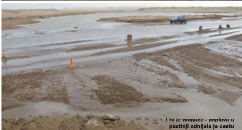
I to je moguće - poplava u pustinji odnijela je cestu