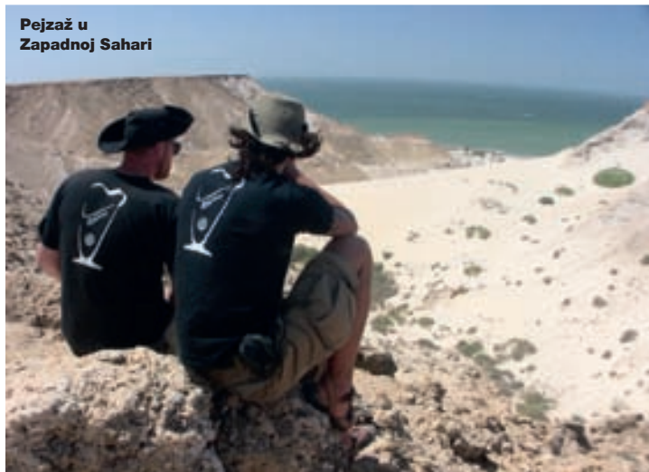
Pejzaž u Zapadnoj Sahari