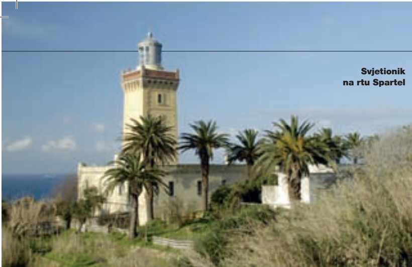
Svjetionik na rtu Spartel