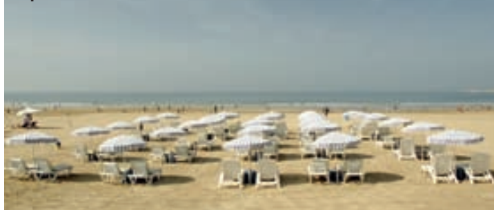
U Agadiru je sve podređeno turistima sa zapada - ogromna pješčana plaža je oivičena neprekinutim nizom kafea i restorana

(Drugi nastavak u narednom broju Maxija)