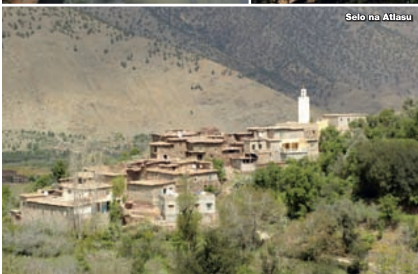
Selo na Atlasu