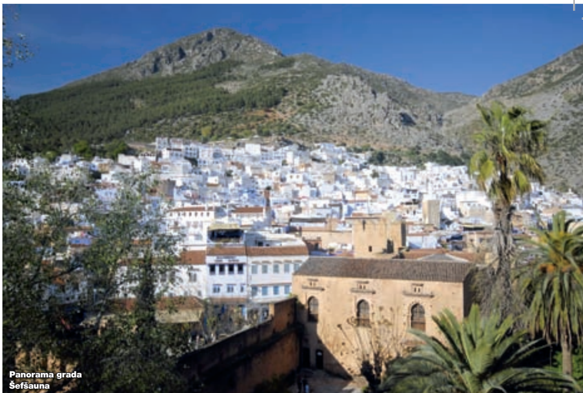
Panorama grada Šešsuauna