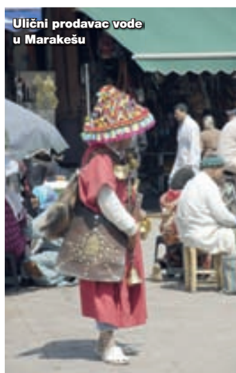
Ulični prodavac vode u Marakešu

Uspon koji sam bio zamislio kao malo naporniju šetnju po lijepom vremenu i čistom planinskom zraku, pretvorio se u pravu borbu. Sad ne smijem stati, a jedva imam snage da idem dalje. Pokrećem noge