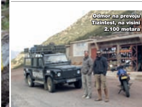
Odmor na prevoju Tizintest, na visini 2.100 metara