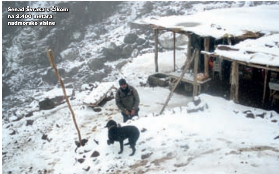
Senad Švraka s Ćikom na 2.400 metara nadmorske visine