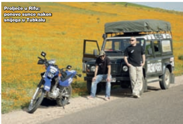
Proljeće u Rifu: ponovo sunce nakon snijega u Tubkalu

Želim da se zahvalim svima koji su podržali našu ekspediciju u Saharu, a prije svega Bihaćkoj pivari, BHT-u 1, agenciji Colosseum iz Tuzle, radiju Kameleon i, naravno, Maxiju.