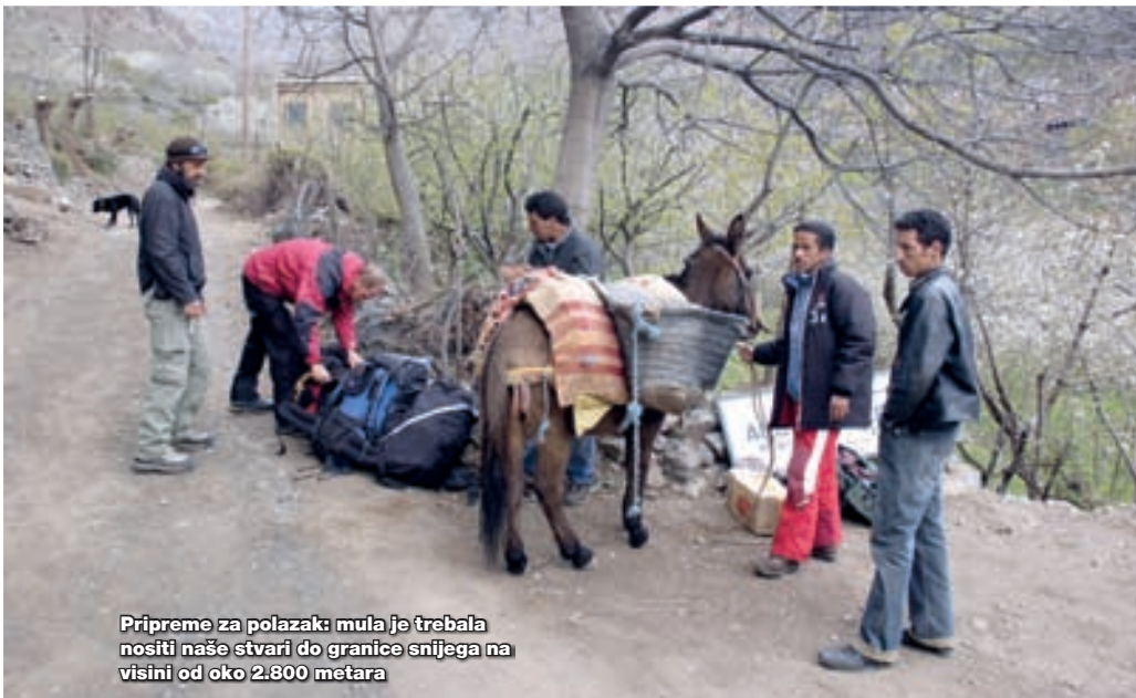
Pripreme za polazak: mula je trebala nositi naše stvari do granice snijega na visini od oko 2.800 metara