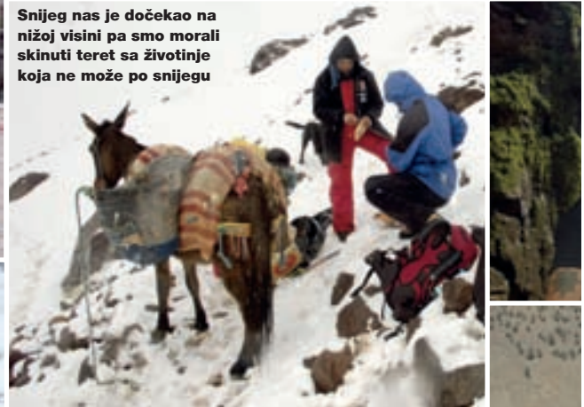
Snijeg nas je dočekaao na nižoj visini pa smo morali skinuti teret sa životinje koja ne može po snijegu