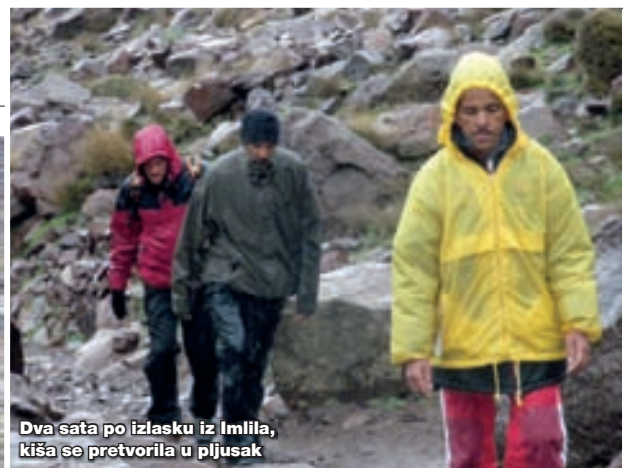
Dva sata po izlasku iz Imlila, kiša se pretvorila u pljusak