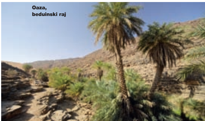
Oaza, beduinski raj

Niko tamo nije nikad vidio Bosanca, iako su svi čuli za Bosnu. Pitali su nas, s iskrenim interesovanjem, da li se situacija kod nas popravila. Radovali su se našoj posjeti, pozivali nas da ostanemo duže i da se osjećamo kao kod kuće