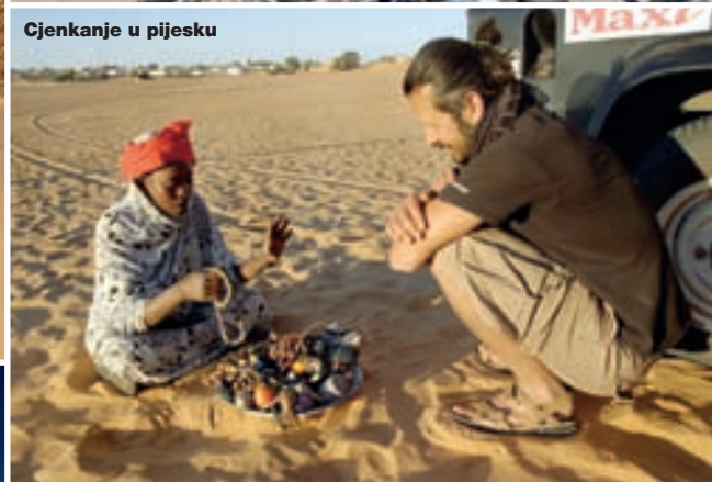
Cjenkanje u pijesku