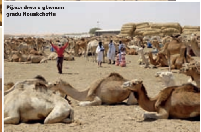
Pijaca deva u glavnom gradu Nouakchottu

mora do Atlantskog okeana prekrivajući površinu od devet miliona kvadratnih kilometara. U jednom kratkom putovanju kao što je naše, nemoguće je istinski upoznati taj ogromni prostor. Zato smo zadali sebi precizan cilj - posjetu starim gradovima Chinguetti i Ouadaneu, oko 650 km sjeveroistočno od Nouakchotta. Glavni grad i ugodnu svježinu Atlantskog okeana napustili smo dobrom asfaltnom cestom koja spaja Nouakchott s Atarom. Poslije samo dvadesetak kilometara vožnje, zapahnuo nas je vruć pustinjski vjetar. Klimatski uticaj okeana nije dopirao dalje. Ovdje je Sahara nametala svoj zakon. Vozili smo se cijeli dan među pješčanim dinama i golim vulkanskim brežuljcima. Tu i ta-