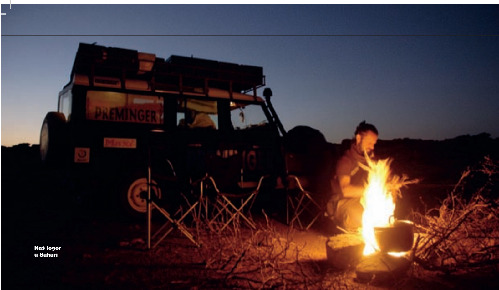
Naš logor u Sahari

Oko 120 kilometara makadama razdvaja Chiguetti od Ouadane, drugog impresivnog starog grada koji se nekad debelim zidinama morao braniti od upornih napada pljačkaša, a danas je doslovno u ruševinama.