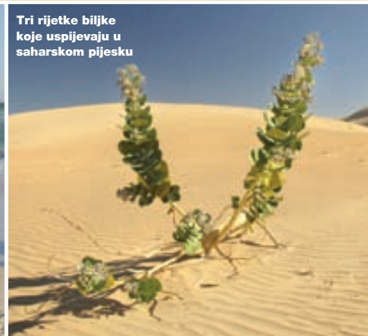
Tri rijetke biljke koje uspijevaju u saharском pijesku