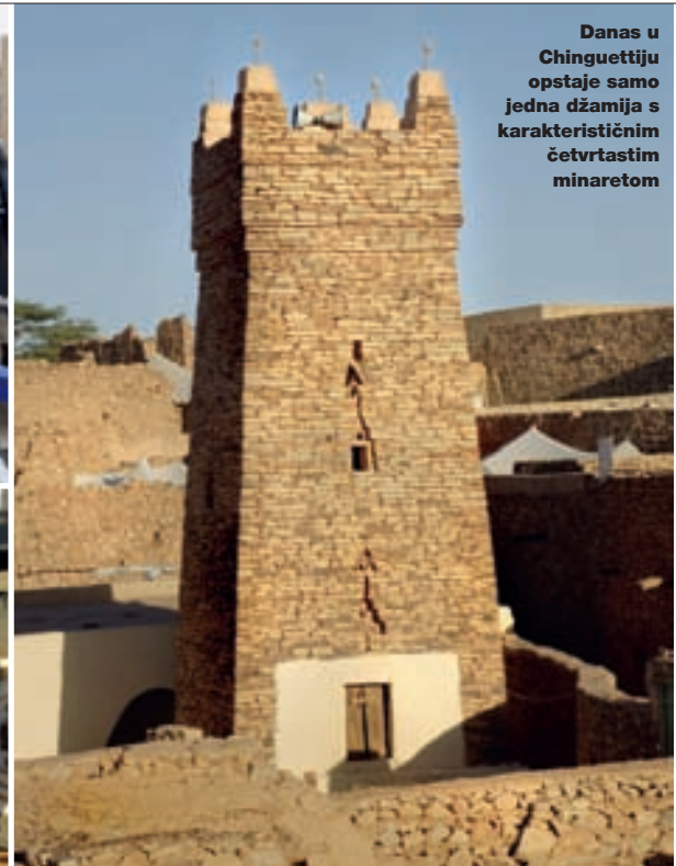
Danas u Chinguettiju opstaje samo jedna džamija s karakterističnim četvrtastim minaretom