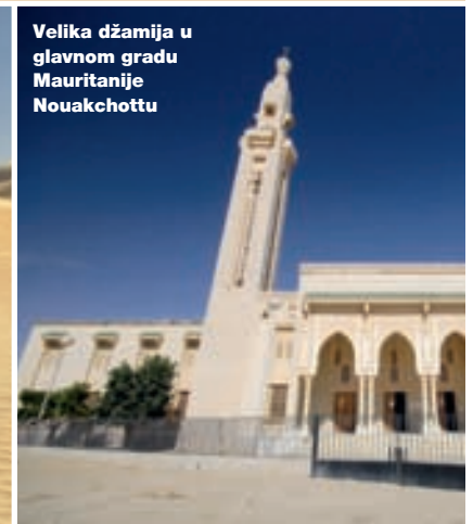
Velika džamija u glavnom gradu Mauritanije Nouakchottu

aura za osiguranje. Evropska osiguranja ne pokrivaju teritoriju Mauritanije, pa smo morali kupiti odgovarajuće osiguranje za vozila na licu mjesta. Atmosfera na granici je pomalo zbunjajuća za bijelce nenavikle na afrički stil, ali, u suštini, sve je