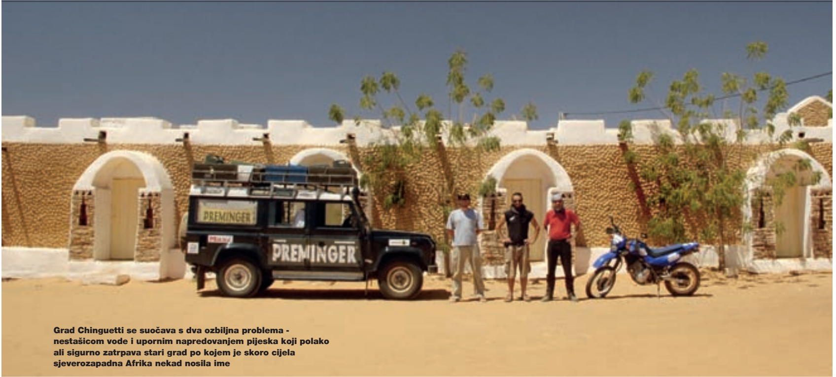
Grad Chinguetti se suočava s dva ozbiljna problema - nestašicom vode i upornim napredovanjem pijeska koji polako ali sigurno zatrpava stari grad po kojem je skoro cijela sjeverozapadna Afrika nekad nosila ime