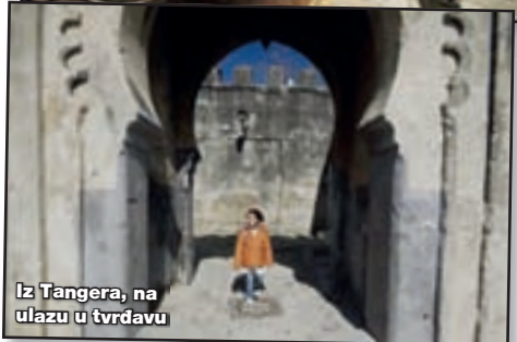
Iz Tangera, na ulazu u tvrđavu