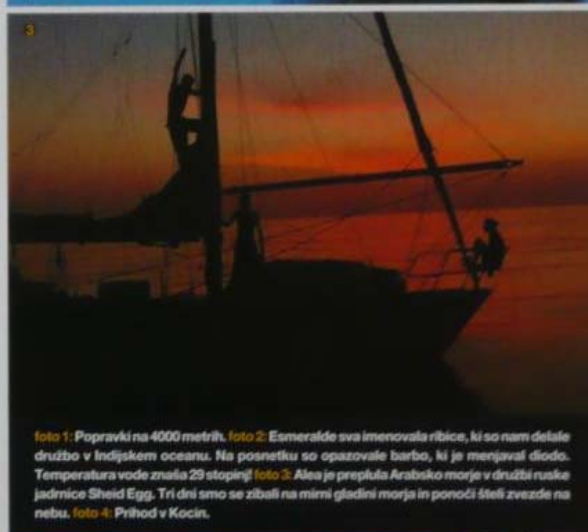
foto 1: Popravki na 4000 metrih. foto 2: Esmeralde sva imenovala ribice, ki so nam delale družbo v Indijskem oceanu. Na posnetku so opazovale barbo, ki je menjavala diodo. Temperatura vode znaša 29 stopinj! foto 3: Alea je preplula Arabsko morje v družbi ruske jadrnice Sheid Egg. Tri dni smo se zibali na mirni gladini morja in ponoči šteli zvezde na nebu. foto 4: Prihod v Kočin.