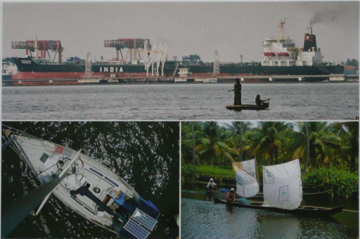
foto 1: Mogočna reka Kočin, po kateri je v vsakem primeru gost promet v obe smeri. foto 2: Pogled na Aleo z vrha jambora. foto 3: Jadranje po reki je bilo poceni in za spremembo drugačno od tistega, ki smo ga vajeni. spodaj: Ljudje na plaži uživajo tako kot posod o svetu.

Maldive, nekaj mesecev preživeti na Čagosu, nato pa se obrniti proti Madagaskarju in Južni Afriki in pluti tako kot vsi, z vzhoda na zahod. Ves čas plovbe skozi Rdeče morje in preko Arabskega morja do Indije načrta nisem spreminjal. Ko pa sem prišel v Indijo, se je zgodilo nekaj nenavadnega. Čagos je izgubil magnetno privlačnost, ki sem jo tako živo čutil in v mislih negoval ves čas potovanja. Podobno misel je imel Kosta, skiper jadrnice Sheid Egg. V Indijo je nameraval zato, da bi tam oskrbela jadrnico za pot, kar bi lažje izvedli v Indiji kot na Maldivih, pa še cene so nižje. In prav to je bil razlog, da sva se ustavila v Indiji. Turistični vidik te dežele ni bil najbolj pomemben, pač pa oskrba in drobna popravila. Ampak ko je Barba 22 sedel v kokpitu sredi reke Kočin, se je preden postavil velik problem: ni se mu več dalo na Čagos, zdaj bi šel na Tajsko.