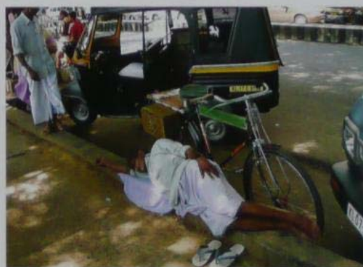
Tipičen prizor z ulice v Kočinu – za počitek je vsak kraj dober.

Misel, da bi preživel nekaj mesecev na pustem otoku sredi oceana, se hranil z ribami in kokosovimi orehi, me je vse bolj osvajala, postala je moja obsedenost, hranila je moja željo, skratka ni mi dala miru. Zavedal sem se, da je Alea majhna in neprimerna za tako dolgo pot, kjer na pustih otokih ni ničesar in je treba vse, kar potrebuješ za preživetje, imeti s seboj. A tu ni bilo več pomoči, razlogi niso imeli teže, jadrnico sem pripravil za Indijski ocean, mislil pa na Čagos. Pot sem izračunal tako, da sem najprej nameraval odpluti iz Omana na