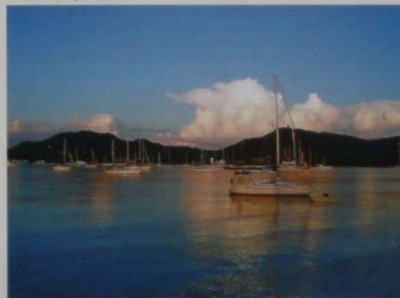
Sidrišče Chalong na Tajskem.

Nekaj volje po drugačnosti je zaslediti pri mladih, ki bi želeli zgraditi ponton za jahte, restavracijo na plaži, vendar o tem odloča poglavar, ki je trenutno v zaporu, ker je poneverjal denar, novi pa še ni imenovan ... In tako se trenutno ne dogaja nič, kajti poglavar je izvajalec oblasti in preko njega poteka komunikacija s centralno vlado. In tako v nekem smislu ni kaznovan le poglavar ampak ves otok!