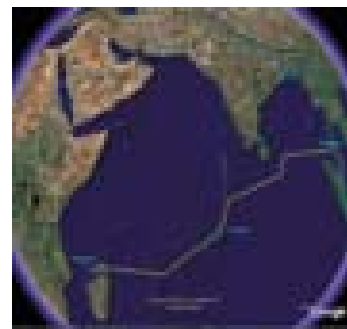
Potovanje Alee leta 2007.

Usedel sem se na tla kabine in poskušal malo spočiti, a me je prevzela nepopisna nervoza. Moral sem se nečesa lotiti, da sem svoje misli usmeril drugam. Po kabini sem pobiral knjige, cunje in druge uničene stvari in jih metal v morje. Poskušal sem ponovno vzpostaviti red na barki. Ob šestih sem zagledal silhueto obale Madagaskarja, ob sedmih pa je vzšlo sonce. Nebo je bilo povsem brez oblaka. Po sedmih dneh plovice, po pretežno deževnem in oblačnem vremenu, je bil to prvi sončen dan. Ob osmih zjutraj sem v daljavi zagledal črno-beli stolp svetilnika in premec Alea naravnal naravnost proti njemu. Ker sem sedaj jadral proti vetru, Alea ni mogla več sama držati smeri, zato sem moral prevzeti krmilo. Do konca sem razvil jadra, da bi malo povečal hitrost in ublažil zibanje po valovih. Valovi s penecimi vrhovi so Aleo privzdigovali in se z njo poigrali kot z igračko. Vrh vala se je zrušil tik za Aleino krmo, nikoli pa ni udaril ob njo. Val je nato šel pod trupom in Alea je ponovno oddrsela v dolino med dvema valoma. Vse se je odvijalo zelo nežno, brez brutalnosti, a sem kljub temu moral paziti, da za krmilom nisem naredil kakšne napake.