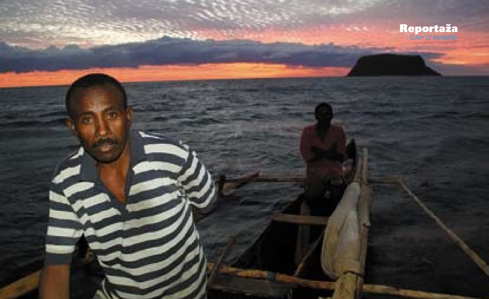
Nosy Mitsio. Domačini s katerimi sem trgoval.

minutami 8 mm debelo pleksi steklo, ni bilo ničesar. Na ostrih robovih razbite plastike sem si porezal dlan, ampak v tistem trenutku nisem čutil bolečin, saj me je prevzela jeza, ker je bila ob morebitnem novem valu pot v kabino odprta. Ne smem paničariti, sem pomislil. Najprej moram ustaviti barko.