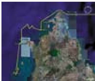
Prihod Alee na Madagaskar.

Okoli devetih se je smer spremenila proti zahodu in valovi so se postopoma nižali in krajšali. Kot začarana se je Alea nenadoma znašla v povsem mirni vodi, čeprav se je veter še naprej valil s hribov