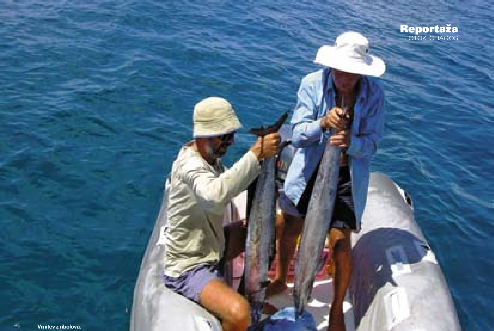
Vrnitev z ribolova.

od sosedov ni prinesel kakšne ribe, kar je pogosto, se vkrcam v čolnici in čez pet minut se na trnku znajde tunica. Dovolj velika za dva obroka. Več kot z ribolovom se ukvarjam s potapljanjem, saj je podvodni svet čudovit. Domislil se dobrega trika, kako čim lažje čim globlje. Uporabim sidrno verigo, da se spustim na šest metrov globine brez napora. Usedem se na dno, se umirim in ribice, ki so se med mojim spuščanjem razbežale, me znova obkrožijo. Ostanem, dokler morem, nato spustim verigo in splavam na površje. Vzlet na površino je fantastičen, tako si domišljam, da se počutijo astronauti med vesoljskim poletom, le da jaz opazujem ribice, oni pa zvezde.