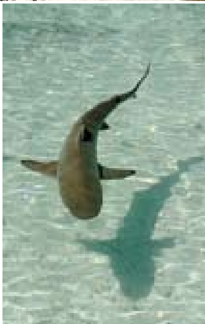
Black Tip Shark živi v laguni.