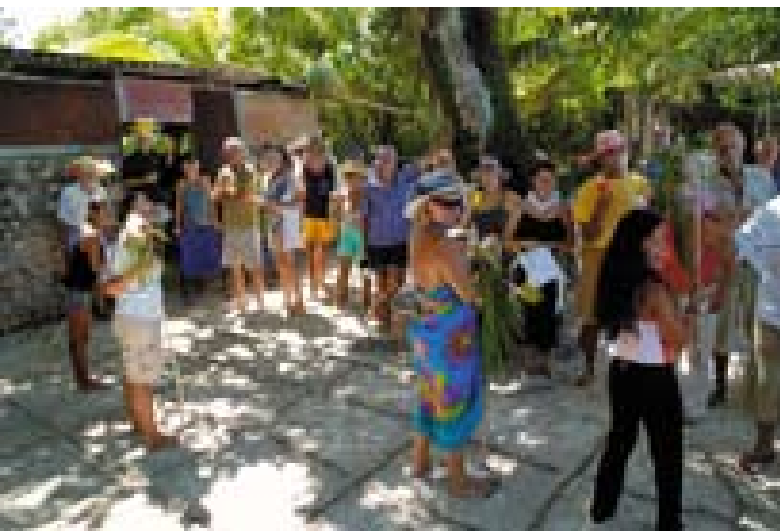
Zabava na Čagosu.

Žal bralcem Vala preprosto ne morem popisati treh čudovitih mesecev, ki sem jih preživel na otoku in so minili kot bi trenil. In ko je prišel čas odhoda, se mi je srce stisnilo od bridkosti. Kako zapustiti takšen raj? Zadnjih 15 dni sem se duševno pripravljal na to, saj se nikakor nisem mogel odlepiti od otoka. Če bi se dalo, bi še ostal, a to ni bilo mogoče. Čakala so me širna morska prostranstva, kot prva postaja na tej poti pa Madagaskar. Še pred tem velikim korakom proti zahodu sem se na kratko ustavljal še na severnem atolu Peros Banhos. A to je že zgodba za drugič. □