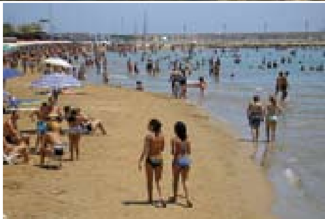
Italijanski Crotone je v znamenju mivkastih plaž in množice kopalcev.