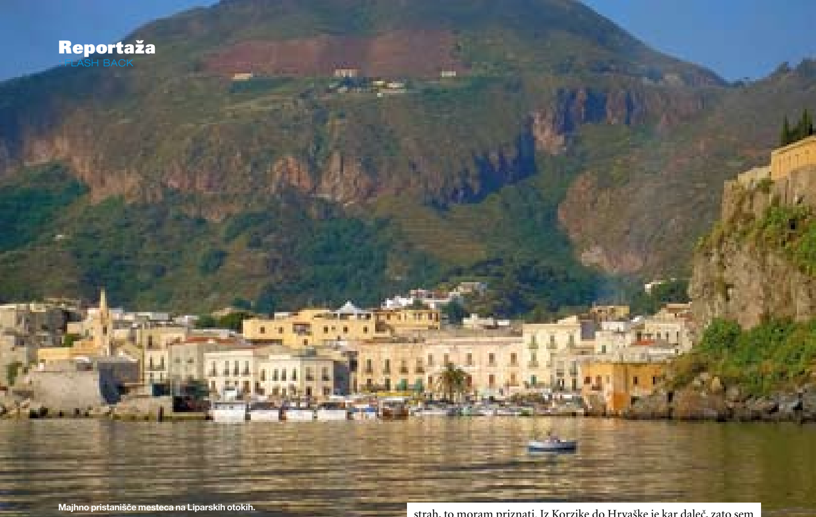
Majhno pristanišče mesteca na Liparskih otokih.