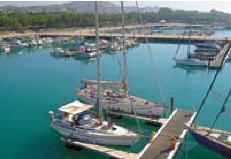
Marina v Rocelli Ionici.

strah, to moram priznati. Iz Korzike do Hrvaške je kar daleč, zato sem se prvič ustavil že v Bonifacciu, nekakšnem fjordu, kjer sem pristal ob 10. uri zvečer. Vodil naj bi me rdeči svetilnik na vhodu, a ga v množici svetil vseh vrst in barv ni bilo lahko prepoznati. Posrečilo se mi je in srečno sem prestal preizkušnjo. Našel sem nepravi svetilnik, ki pa je bil oddaljen od vhodnega, ki je bil pokvarjen, kakšnih 500 metrov. Le malo je manjkalo, da nisem z vrhom jambora podrsal ob navpično steno. Končno sem vplul, našel privez in si oddahnil. Pozneje sem še velikokrat vplul v luko ponoči, a ta krst je bil najtežji od vseh.