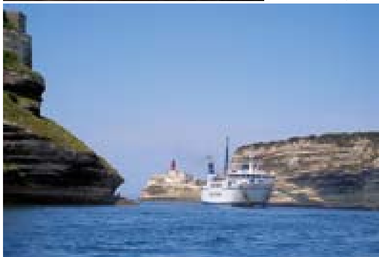
spodaj: Pogled na vhod v fjordu podoben zaliv Bonifaccio, s svetilnikom, ki ni deloval, v ozadju.