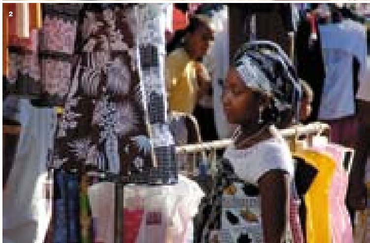
1: Ženske se po obrazu mažejo s kremo, narejeno iz prahu sandalovega drevesa, pomešanega z glino. 2: Ženske so pogosto oblečene v elegantna raznobarna tradicionalna oblačila. 3: Raztovarjanje lesnega premoga. 4: Prebivalec mesta Majunga.